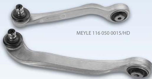
MEYLE 116 050 0015/HD