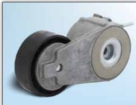
Kuva 1: Versio 1