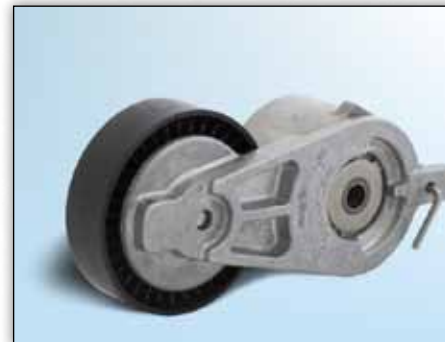
Kuva 2: Versio 2

Esitetyissä autoissa käytetään tehdasasenteisena apulaitekäytön kiristinyksikön kahta eri versiota.