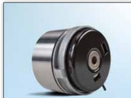
Obrázek 4: Pohled zezadu na novou verzi

Na základě neustálého vývoje našich produktů byla změněna konstrukce napínací kladky 531 0779 10.