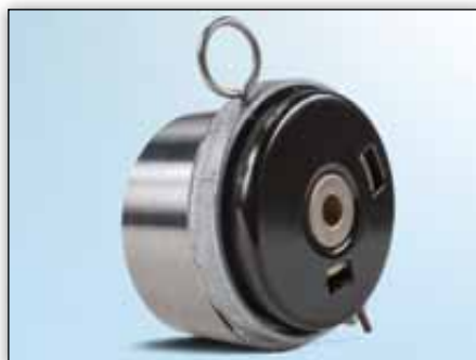
Obrázek 3: Pohled zezadu na dosavadní verzi