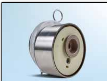
Obrázek 1: Pohled zepředu na dosavadní verzi